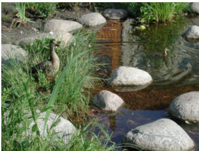
Ytligt liggande damm

Vid dagvattenhantering i öppna system tas således mark i anspråk. För att möjliggöra öppen dagvattenhantering bör beaktande utav detta redan ske i detaljplaneringsprocessen. Det går även att lyfta fram dagvatten i befintliga områden. I befintliga områden kan t ex stuprör kapas och vattnet kan via rännalsplattor ledas ut på gräsmatta och annan växtlighet. Dagvattenledningar som ligger under mark i parker och på friytor kan brytas och miljöer med öppna vattenytor kan anläggas.