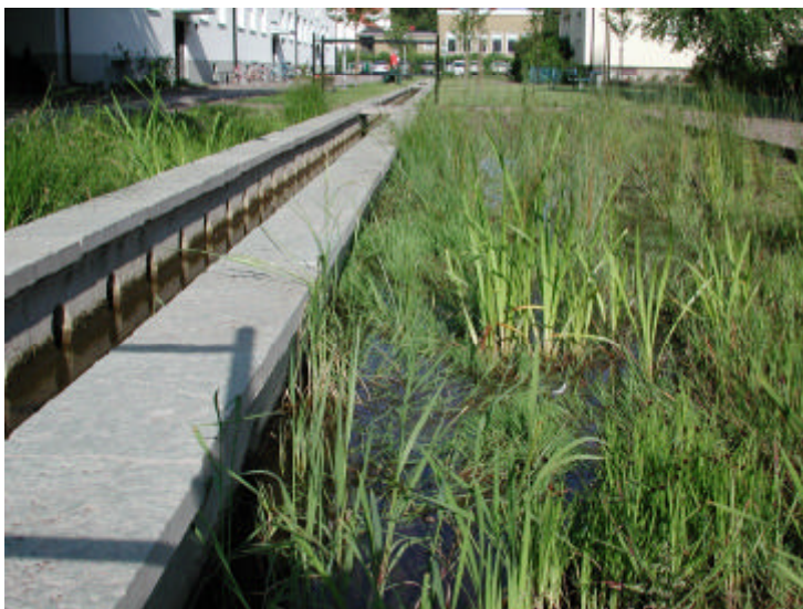
Exempel på öppen dagvattenhantering i stadsmiljö, Augustenborg i Malmö