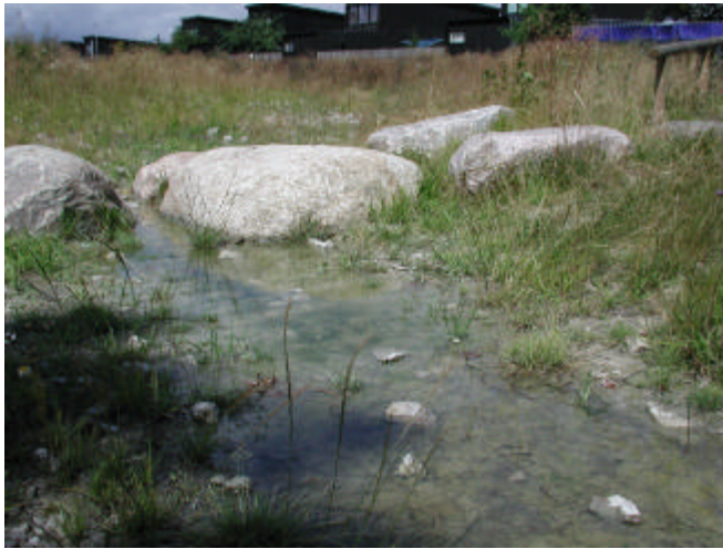
Exempel på lokalt omhändertagande av dagvatten i öppet system