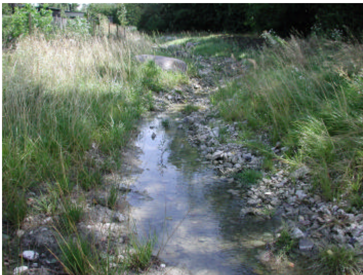
Svackdike med liten släntlutning. Gestaltningmässigt passar det väl in i naturmiljön.

Våtmarker, diken och dammar kan utgöra spännande element i parkmiljöer. Svackdiken och rännदार kan tillföra variation i gatumiljön. Huvudtesen är att gestaltningen skall anpassas efter platsens förutsättningar. I stadsmiljöer kan utformningen göras mer parkliknande medan i mer perifera lägen mer naturlik.