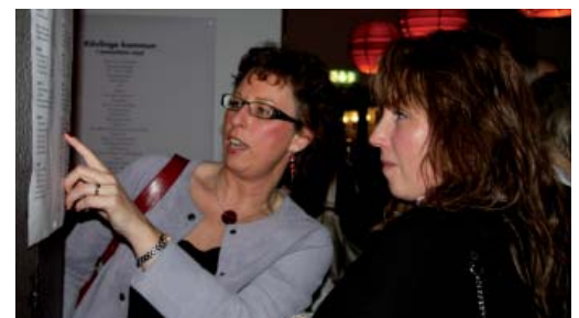
Högvinst vid bordsplaceringen?