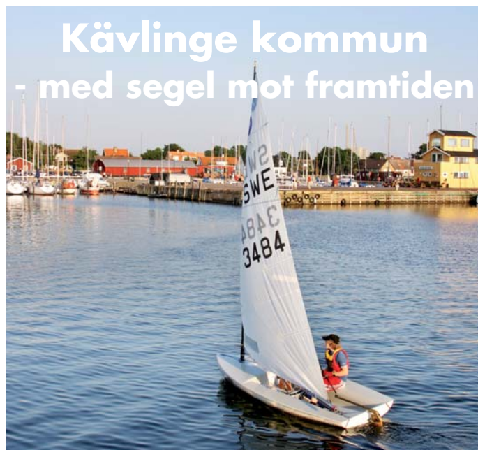
Hur ser det ut i kommunen i framtiden? Vilka människor möter vi? Vilken miljö lever och verkar de i?