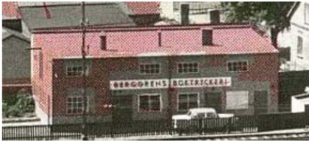
Lilla kulturhuset Mejerigränden sett från järnvägen 1959, då huset var Berggrens Boktryckeri.