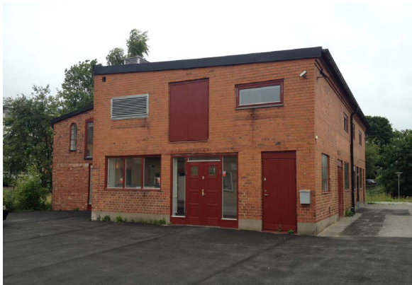
Lilla kulturhuset Mejerigränden 2014.