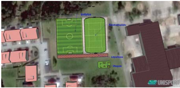
2 JPG Hofterup-3D-Skiss-270916-02