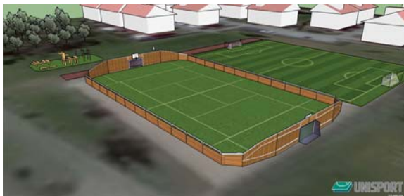
4 JPG Hofterup-3D-Skiss-270916-04