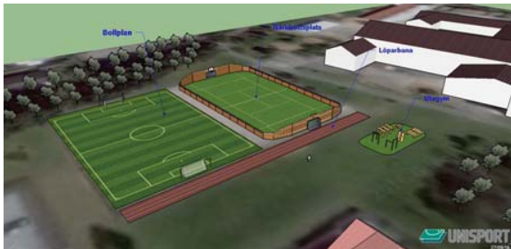
3 JPG Hofterup-3D-Skiss-270916-03