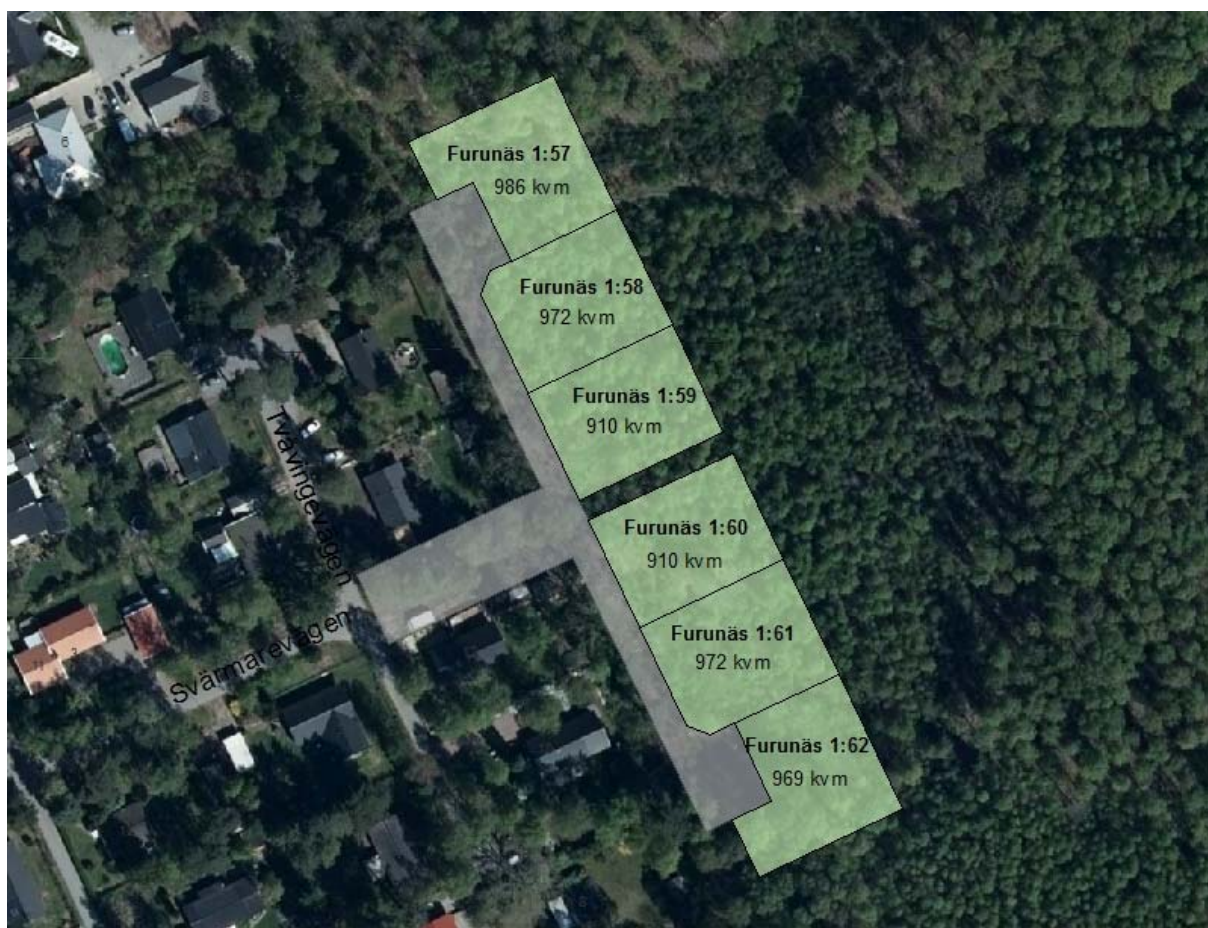
Tomter till försäljning, Furunäs 1:57-62

I Ålstorp finns 6 stycken fribyggartomter till försäljning. Tomterna, Furunäs 1:57-62, är belägna i den östra delen av Ålstorp i en förlängning av Svärmarevågen, i angränsning till Ålstorpskogen. Tomternas storlek varierar mellan 910 och 986 m 2 . En ny gata med två vändzoner kommer att anläggas av kommunen fram till tomterna.