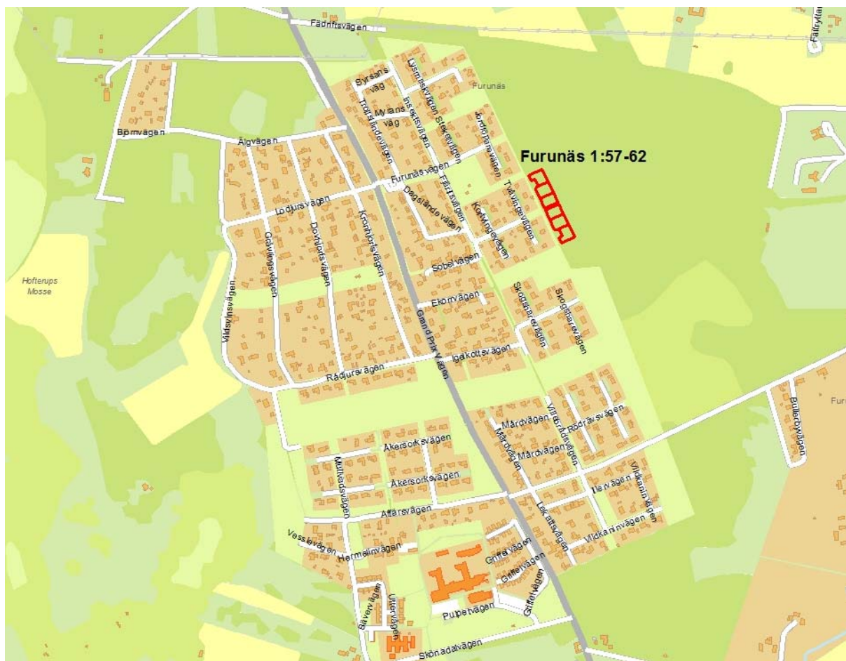
Översiktskarta över Ålstorp. Tomter till försäljning redovisas med röda begränsningslinjer.