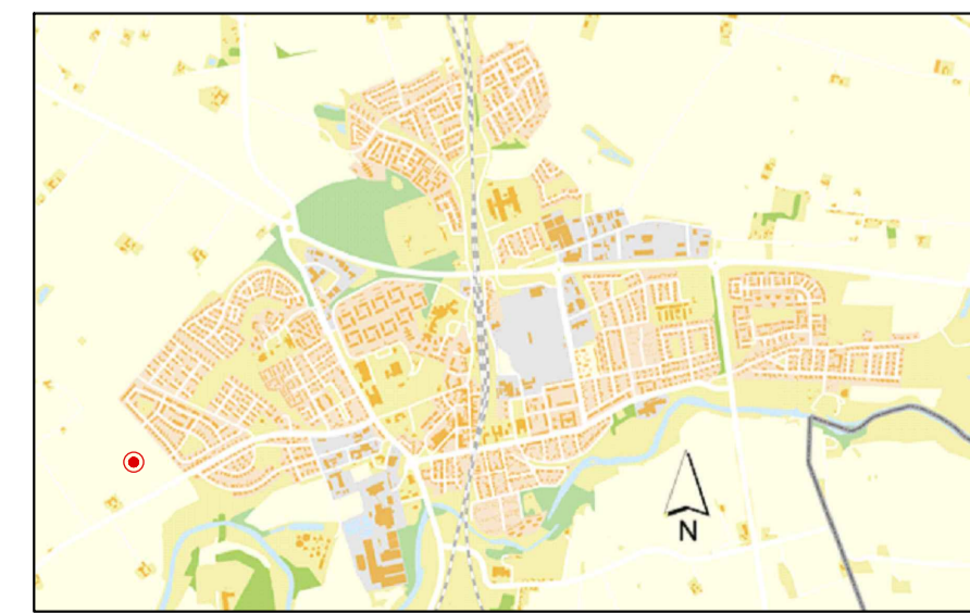
Orienteringskarta över Kävlinge