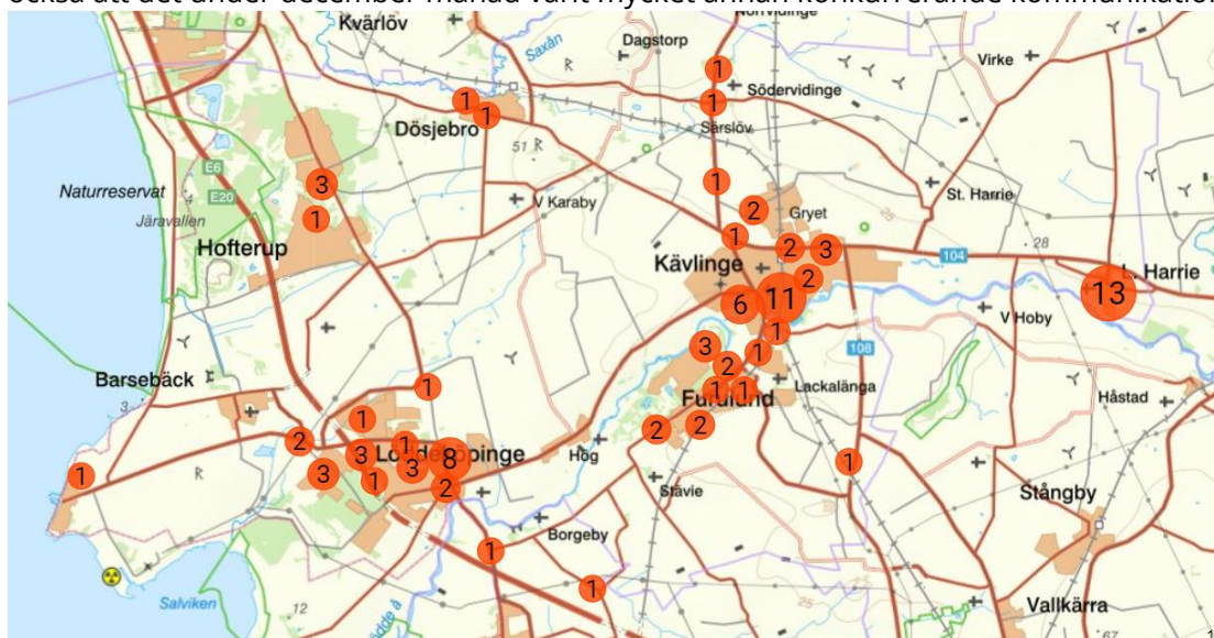
Kartbild för att åskådliggöra hur synpunkterna geografiskt fördelar sig.

Mellan den 1 december och den 31 december genomfördes en digital trygghetsvandring i Kävlinge kommun på uppdrag av Rådet för trygghet och hälsa (RTH). Vi fick totalt in 91 synpunkter, vilket är färre svarande än vid förra trygghetsvandringen som genomfördes i maj 2021. En av orsakerna kan vara att många av de synpunkter som inkom 2021 har åtgärdats men också att det under december månad varit mycket annan konkurrerande kommunikation.