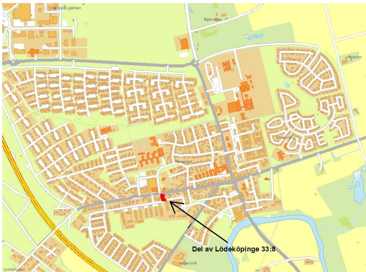
Översiktskarta över Löddeköpinge. Tomt till försäljning redovisas med röd färg.