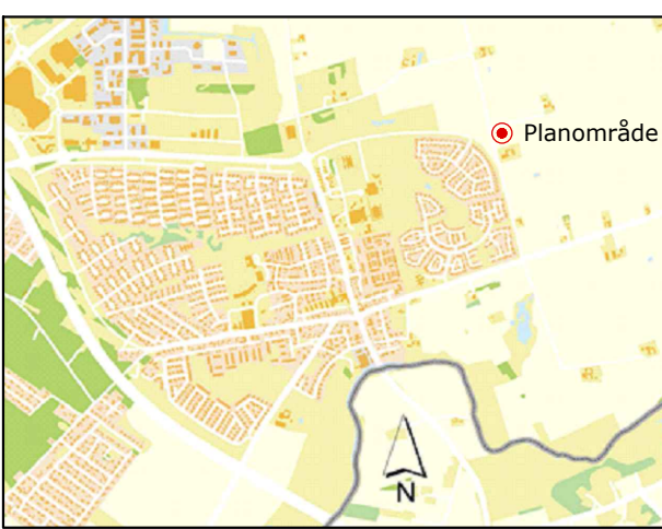
Orienteringskarta över planområdets läge i Löddeköpinge, Kävlinge kommun.