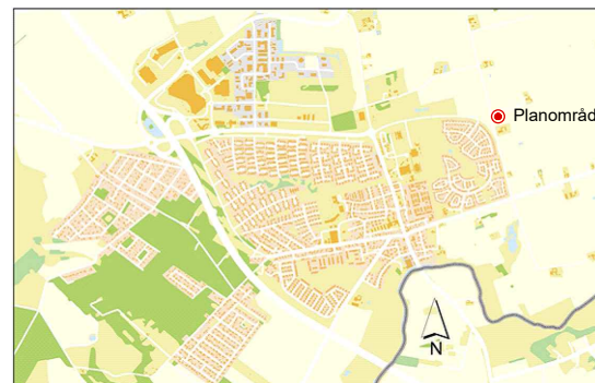
Orienteringskarta över planområdets läge i Löddeköpinge, Kävlings kommun.