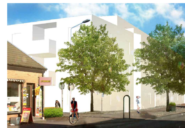
Bebyggelsen mot Kungsgatan från öster (övre bilden) och från väster (undre bilden). Bilderna visar ett av flera möjliga utbyggnadsalternativ.