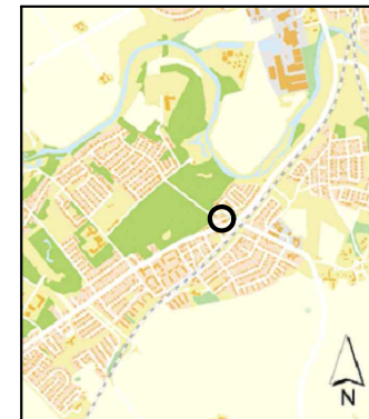
Orienteringskarta över Furulund med planområdets läge.