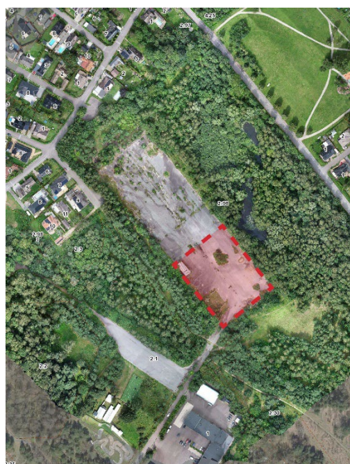
Ungefärlig plats för drop-in samrådet

Planhandlingarna finns tillgängliga från den 17 juni – 21 augusti 2024 på kommunens hemsida: kavlinge.se/detaljplan och i Kävlings kommunhus.