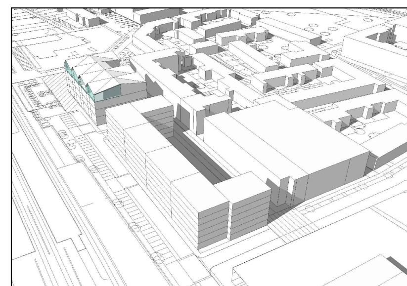
Axonometri från sydväst (Bilden visar ett av flera möjliga utbyggnadsalternativ)