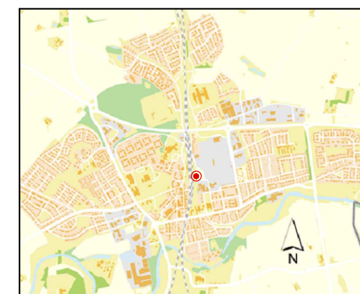
Orienteringskarta över Kävlinge.