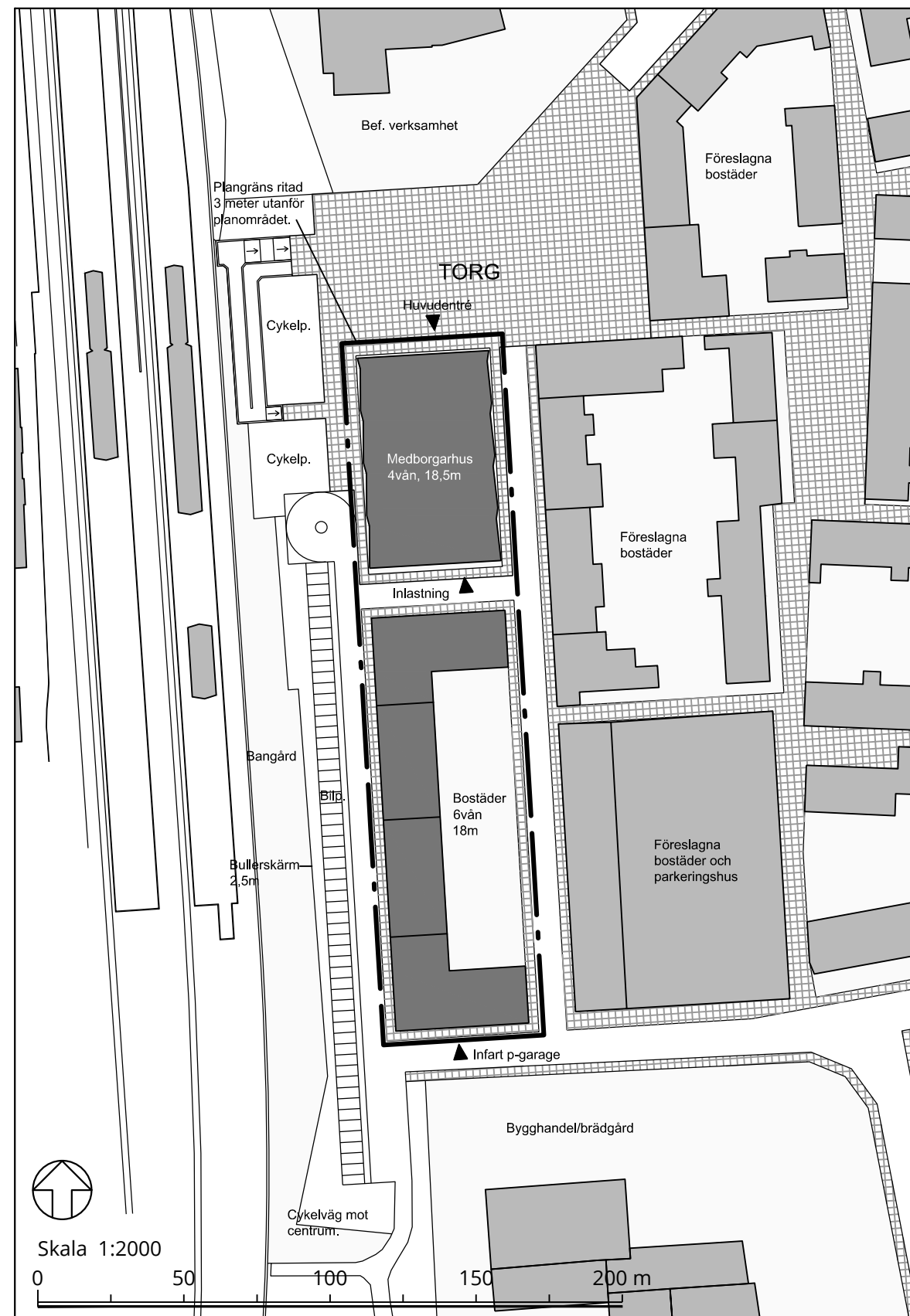
ILLUSTRATION, Skala 1:2000 (A2)