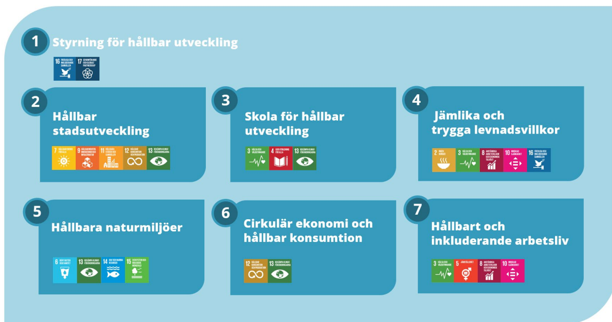
Fig. 4 De sju strategiska områdena.

Strategin inkluderar sju strategiska områden (Fig. 4) och bidrar till Kävlings vision: "Vi formar framtiden!". Varje strategiskt område samlar ett antal väsentliga hållbarhetsfrågor för kommunen. Dessa frågor kan ses som betydande risker eller möjligheter beroende på hur de hanteras. Området "Styrning för hållbar utveckling" redogör för övergripande styrprocesser. De strategiska områdena är ömsesidigt beroende av varandra.