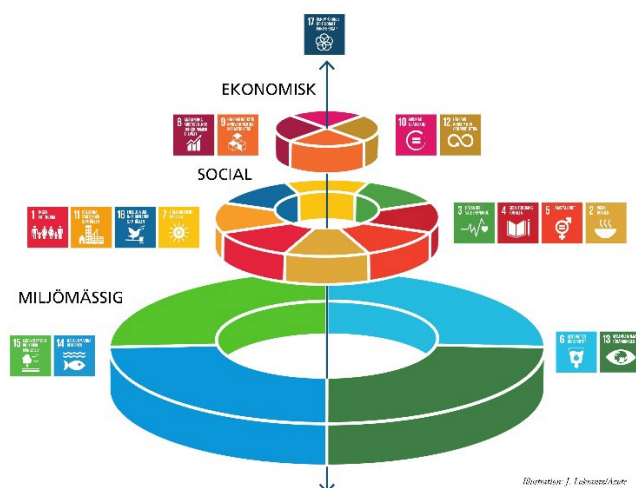
Illustration: J. Löbner/Azote

2015 antog världen Agenda 2030 med 17 globala mål. Dessa mål är nära sammankopplade och avhängiga av varandra. Hur väl vi värnar om miljödimensionen av hållbar utveckling kommer exempelvis att ha en stor påverkan på den sociala och ekonomiska dimensionen vilket illustreras i figur 2.